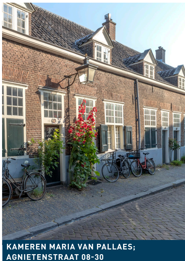
KAMEREN MARIA VAN PALLAES; AGNIETENSTRAAT 08-30