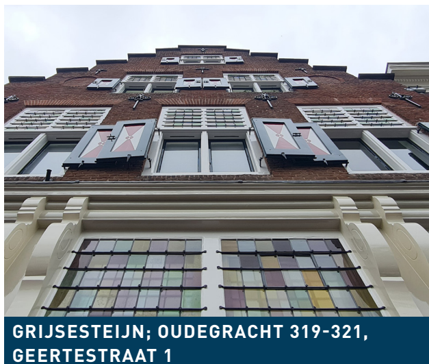
GRIJSESTEIJN; OUDEGRACHT 319-321, GEERTESTRAAT 1

De focus van de werkzaamheden lag voornamelijk op het herstellen van houtrot, het verwijderen van roest op het ijzerwerk, het vervangen van enkele luiken en schilderwerk. Ook zijn de glas-in-lood ramen gecontroleerd en waar nodig hersteld. De bindroedes van deze ramen zijn opnieuw gelakt en stevig vastgezet met een zogenaamd 'roosje'. Alle luiken zijn aan de bovenkant afgedekt met lood om ze te beschermen tegen inregenen. De zij- en de achtergevel zijn opnieuw geschilderd en het citaat van de schrijver C.C.S. Crone, op de zijgevel van het complex, is opnieuw aangebracht door kunstschilder Jos Peeters. Peeters schilderde dit citaat al in 2015. De bewoners hadden destijds het idee om het citaat tijdens het jaarlijkse zomerstraatfeest in 2014 tot leven te brengen. Zij hadden geld ingezameld om dit mogelijk te maken. Met steun van het Utrechts Monumentenfonds, de gemeente en kunstenaar Jos Peeters werd het plan gerealiseerd en was Utrecht weer een Crone-citaat rijker.