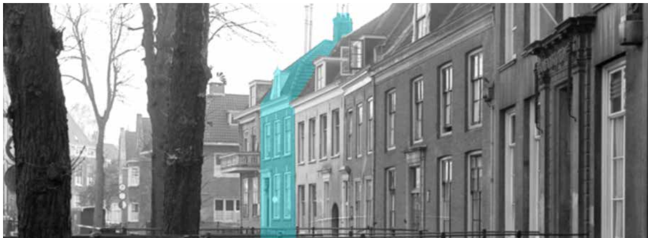
KROMME NIEUWGRACHT 15

Wandelen langs de Kromme Nieuwegracht, dat is duiken in het rijke verleden van Utrecht. Preciezer: dat is duiken in het verleden van de rijken. Deze gracht, de Regenboog van Sint Pieter was de omgrenzing van de immuniteit van Sint Pieter. Rond de Pieterskerk lagen als taartpunten de claustrale erven van de kanunniken met hun huizen, waaraan je kon aflezen dat hun bewoners geen gelofte van armoede hadden afgelegd. De voorkant van zo'n erf was gericht op de Pieterskerk , de achterkant lag aan het water. Over die grenssloot hoefde dus geen brug te liggen.