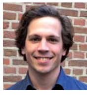
Sep Schetters renovatie & onderhoud