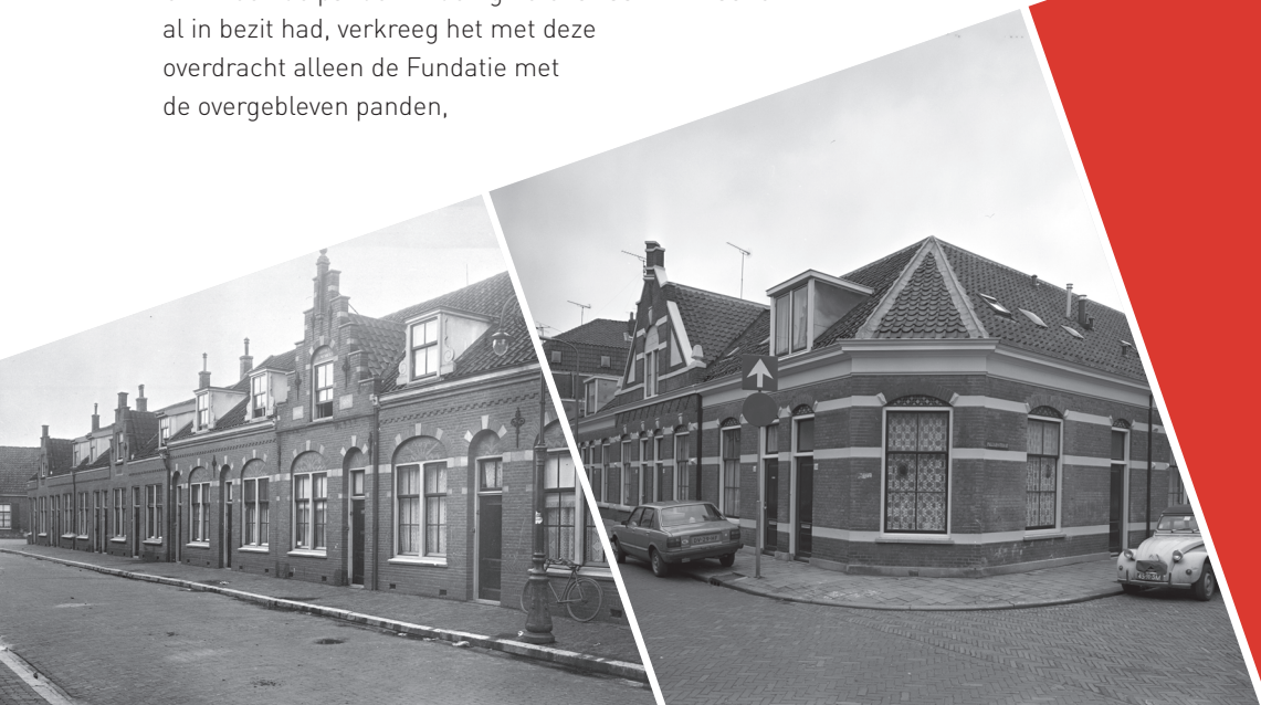
↑ Gezicht op de vrijwoningen aan de Minstraat

Overigens onttrok de gemeente, voordat de overdracht definitief plaatsvond, nog anderhalf miljoen aan de tegoeden van de betreffende fundaties. In 1998 bevond de gemeente zich immers in grote financiële moeilijkheden en stond in feite onder curatele van het Rijk. Er moest echter anderhalf miljoen gulden worden vrijgespeeld voor de daklozenopvang. De bij de op handen zijnde overdracht betrokken fundaties bleken samen tussen de vier en viereneenhalf miljoen gulden in kas te