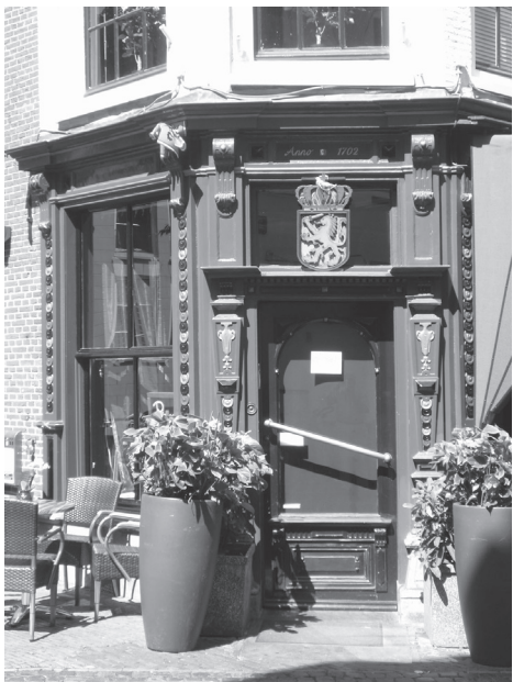
De huidige entree.

den vervangen door grote ramen: het lijstwerk en de ingangseur werden voorzien van fraaie motieven, die wij nu nog aantreffen.