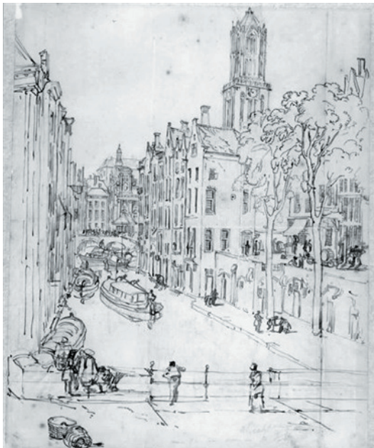
Gezicht op de Oudegracht met Domtoren, vanaf de Gaardbrug, Tekening A.W. Callcott, circa 1825.

prominent aanwezig, maar het hier beschreven huis mag er ook zijn, omdat dit, zoals werd aangegeven in een rapport van de Monumentendienst, zeer beeldbepalend is .