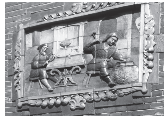
Tegeltabelau met voorstelling van de werkplaats van een goudsmid. Het tableau is geplaatst in de gevel van Zadelstraat 51.

van een geheel ander karakter is, dan eerder werd vervaardigd door hun collega-gildemeesters. In de gildetijd werkten de zilversmeden vrijwel uitsluitend op bestelling van aanzienlijke opdrachtgevers; de latere zilversmeden werkten op grote schaal voor de middenstand en gewone burgers. Er ontstaat dan ook een belangrijke verandering in deze beroepssector. Verschillende goud- en zilversmeden ontwikkelen zich, mogelijk ingegeven door de marktsituatie, tot kashouders, (feitelijk winkelier in goud- en zilverwerken, juwelier), die hun voorraden niet meer van de goud- en zilversmeden betrekken, doch van de optredende grossiers. De hiervoor geschetste ontwikkelingen zien wij terug in de hierna uitvoerig besproken zilversmeden.