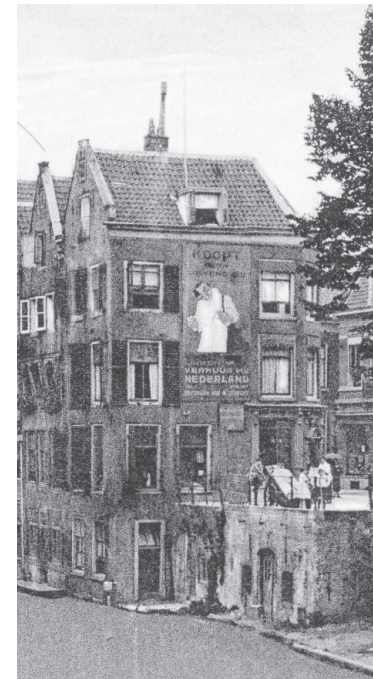
Uitsnedes uit enkele Ansichtkaarten met reclames op de zuidelijke muur van Donkere Gaard 13. Boven: ± 1912, links: ± 1925, rechts: ± 1929.

Het 'beeldbepalend' zijn van het hoekhuis Donkere Gaard 13 had, met name in de periode 1870-1930, nog een andere functie: men verhuurde de lege muurvlakken, voor het aanbrengen van reclames. Op de genoemde Ansichtkaarten, maar ook op oudere foto's, zien we dat de zuidgevel voor dit doel goed werd benut met reclames van respectievelijk Naaimachinefabriek Van Rennes; Liebig; Rotterdamsche Verzekerings-Sociëteit (RVS); Koninklijke Brouwerij Amsterdam; A. Meyer/depot Hengelosche Bierbrouwerij; OXO (Nederlandse OXO maatschappij, Rotterdam, met bouillon-blokken voor 'buitengewoon geurige natuurlijke vleesbouillon');