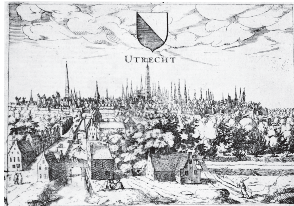
Zo zag de Florentijnse edelman Lodovico Guicciardini in 1570 de stad Utrecht – gravure uit 1616

Naast een redelijk kapitaalcrachtige thuismarkt, met name door de kanunniken verbonden aan de Dom- of de Oudmunsterkerk en de parochiekerken, naast de goeude burgers,