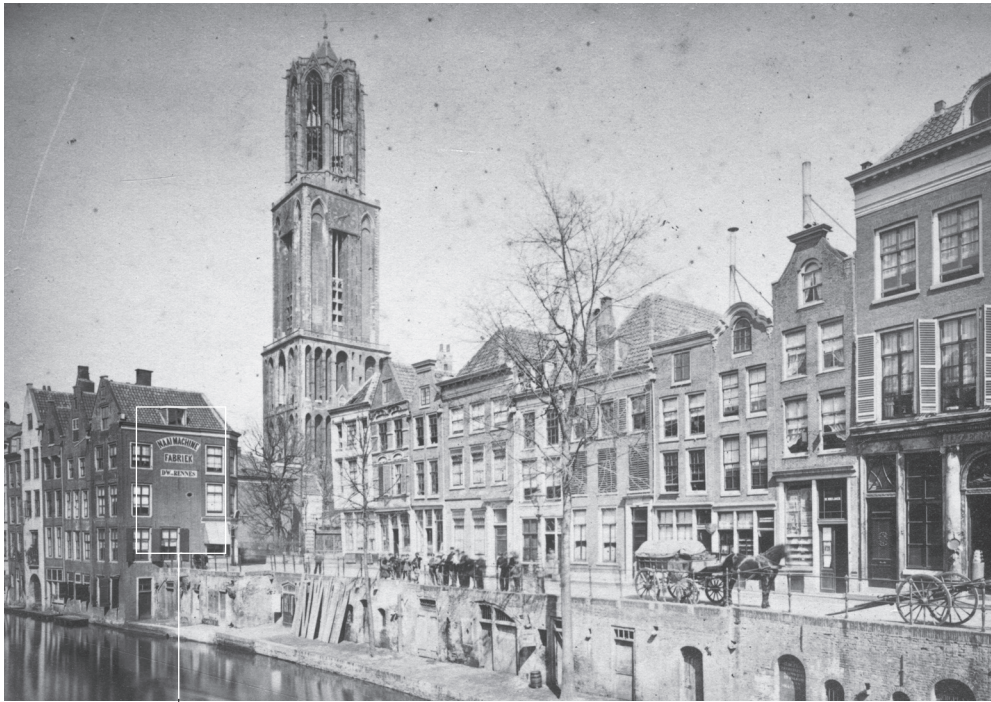
Vanaf de Gaardbrug ±1870