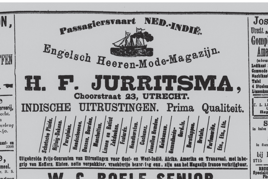
Advertentie in het Provinciaal en Stedelijk Dagblad, 18 maart 1888