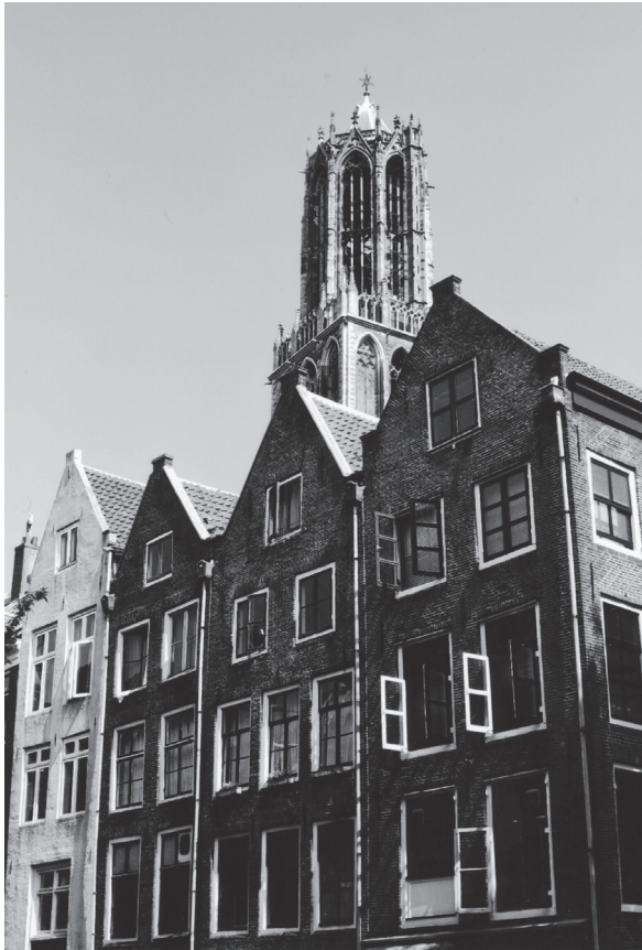
de toppen van de gracht-gevels van Donkere Gaard 9, 11bis, 11 en 13