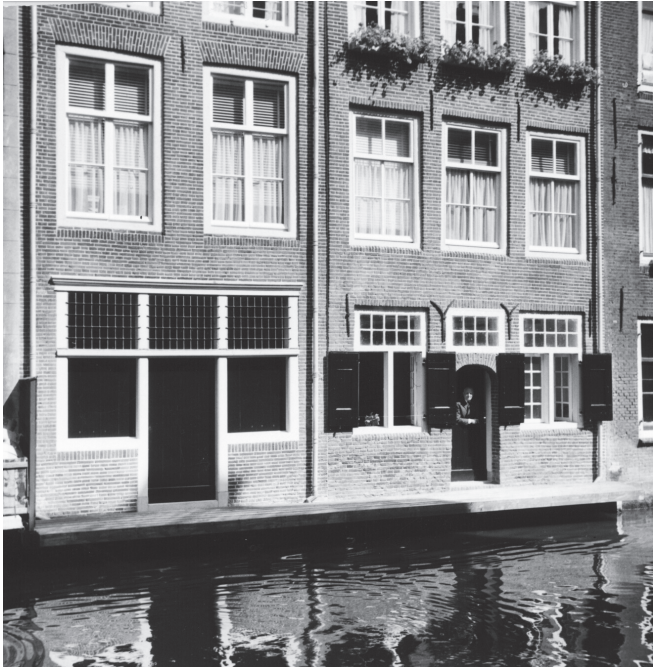
Keldergevels van 11bis en 11