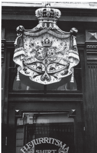
Het wapen van Koningin Emma