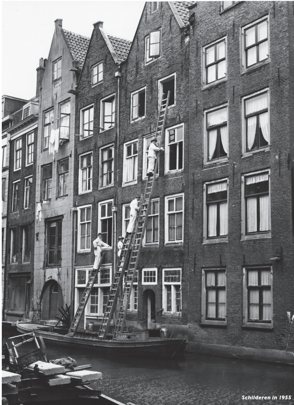
Schilderen in 1955

de woningen werd gehandhaafd, hetgeen valt af te leiden uit het bestaande hoogteverschil van de vloeren op met name de eerste verdieping van nr. 11.