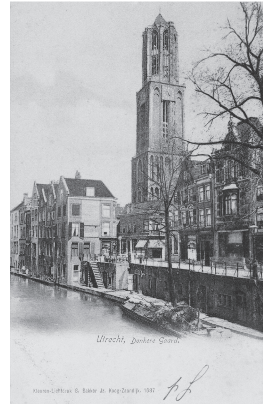
Ansichtkaart rond 1900