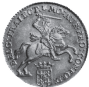
vergroting ca. 130%

Gouden munten spreken altijd tot de verbeelding, dus laten we onze fantasie eens de vrije loop. Als we aannemen dat de koper de koopsom van f 990,- in gouden ridders bij de notaris heeft uitgeteld, dan zullen dit er dus ruim 70 zijn geweest, met een gewicht van ruim 700 gram. Al met al een redelijk geldzakje vol, dat de verkopers thuis op een veilige plaats hebben verstopt. Na hun overlijden weten de erfgenamen van niets en stel dat eerst in 2008 het geldzakje wordt ontdekt. De vinder heeft dan een fortuin in handen, want de huidige waarde van deze munten bedraagt ca. € 960,- per stuk, dus zou hij bij verkoop ruim € 66.000,- kunnen ontvangen. Overigens is, gerekend naar de koopkracht van dit moment, het bedrag van f 990,- in 1762, te vergelijken met ca. € 7.800,- (f17.189,- nu. 14 )