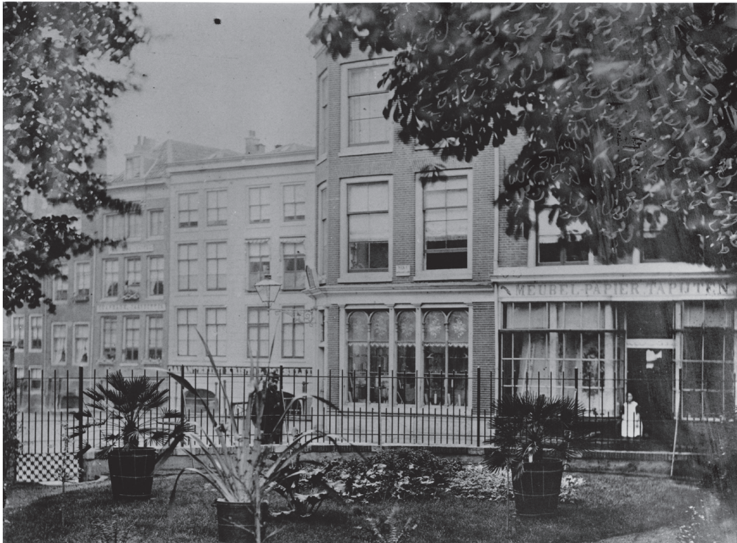
Foto vanuit de tuin van Donkere Gaard 4

ningen die met elkaar verbonden zijn door tussendeuren. Hoe het pand er daarna zal hebben uitgezien blijkt uit een foto die omstreeks 1870 werd genomen, vanuit de tuin bij het tegenover gelegen huis, Donkere Gaard 4 (Flora's Hof).