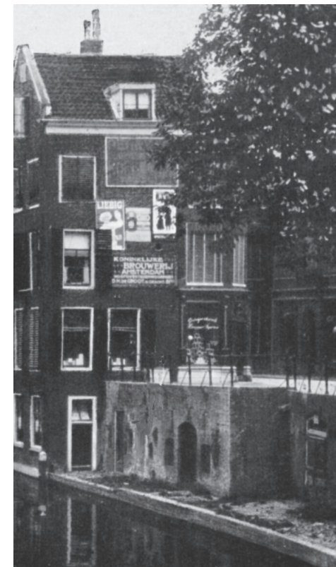
De kelders van nummer 15 (afgebroken) en op de plaats van het wed hebben aan de gracht nog de oude middeleeuwse rooilijn. (deel van een oude ansichtkaart).