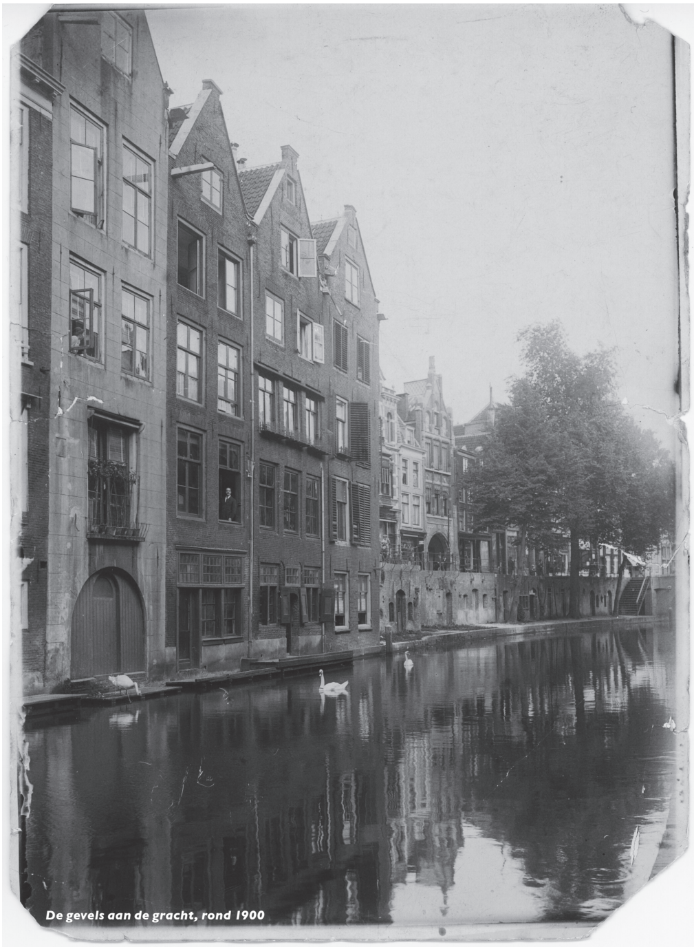
De gevels aan de gracht, rond 1900

Met gebrek aan ervaring, maar wel met veel enthousiasme, heb ik ingezet op het in kaart brengen van gegevens van alle huizen in de Donkere Gaard, voor zover gelegen langs de Oudegracht, te weten de nummers 1 tot en met 13 en tevens het medio 1600 afgebroken pand aan de zuid-zijde. De onderzoeksresultaten waren echter zo talrijk, dat voor een uitgave in dit kader een keuze moest worden gemaakt. Het is begrijpelijk dat de keuze dan ook gevallen is op de panden Donkere Gaard II-IIbis, waar mijn vrouw een groot deel van haar jeugd heeft doorgebracht en mijn schoonvader bijna 50 jaar zijn brood heeft verdiend. Zijn liefde voor deze panden en haar belang voor de Utrechtse binnenstad deed hem, in 1961 besluiten tot restauratie, waaraan ook het UMF haar medewerking verleende.